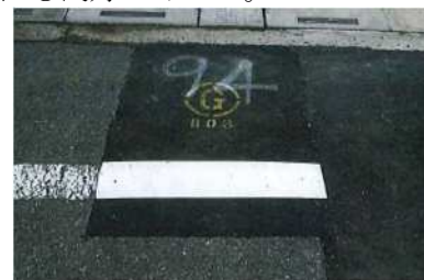
写真-9 施工2ヶ月後の状況