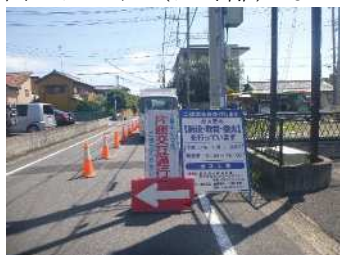
写真-7 施工場所の概況

試験施工の結果、写真-9に示すように、施工2ヶ月後の路面を観察すると、大きな凹み、わだち、表面のはがれ（はく離）などが全く無く、現道での供用性、耐久性も良好であった。