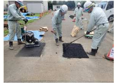
写真-3 BOXヒータによる加熱