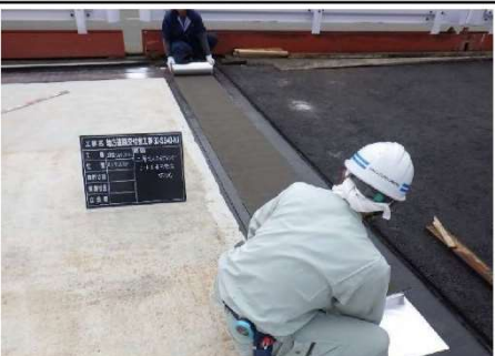
4.二層式スライディングシート敷設（上層用）