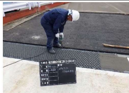
6.ヘキサロック® 舗設・固定アンカー打ち込み