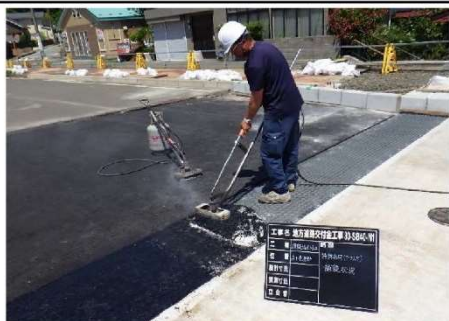
8.基層：特殊混合物舗設