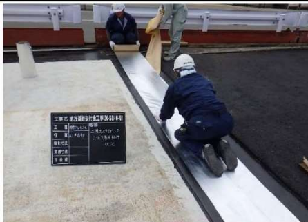
3.二層式スライディングシート貼付（下層用）