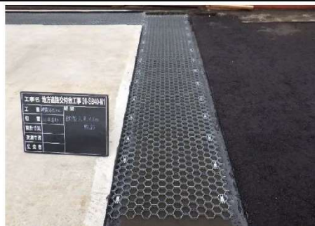
7.ヘキサロックパネル敷設完了