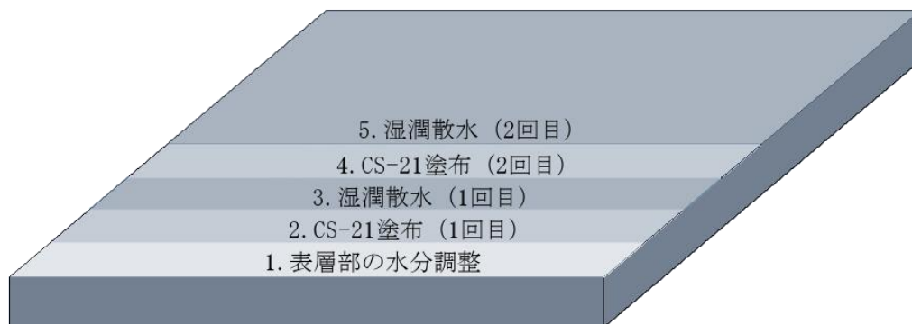
CS II 工法概要図

※ 標準塗布量は、実績に基づく標準的な値であり、対象構造物の表層状態、環境条件および目的等によって増減する場合がある。