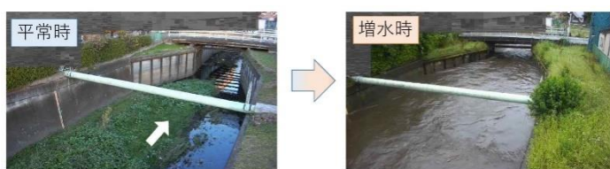
石神井川の洪水時の様子【柳沢橋（西東京市）のカメラ画像：令和5年6月2日台風2号時】

この度、本管トンネルとは別に工事発注する 連絡管トンネル工事 に関する検討が進んだことから、設計段階における工事内容や施工方法などをお示しする説明会(オープンハウス形式) (※) を開催いたします。説明会の日時、場所等の詳細については、 裏面 をご覧ください。