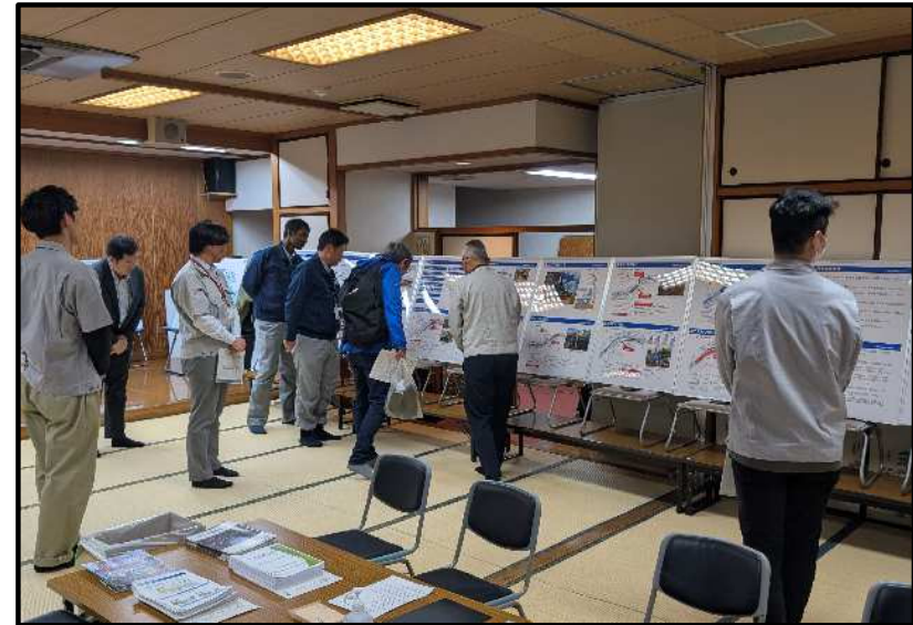
【その171工事の説明の様子】