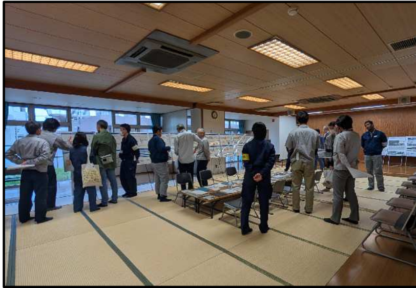
【その170工事の説明の様子】