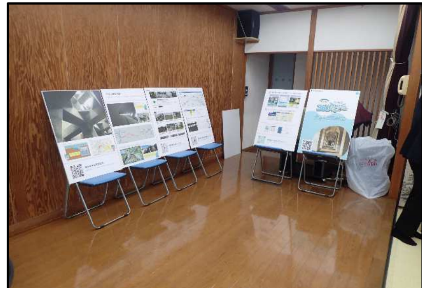
【河川施設バーチャルツアー、水防システムの紹介】