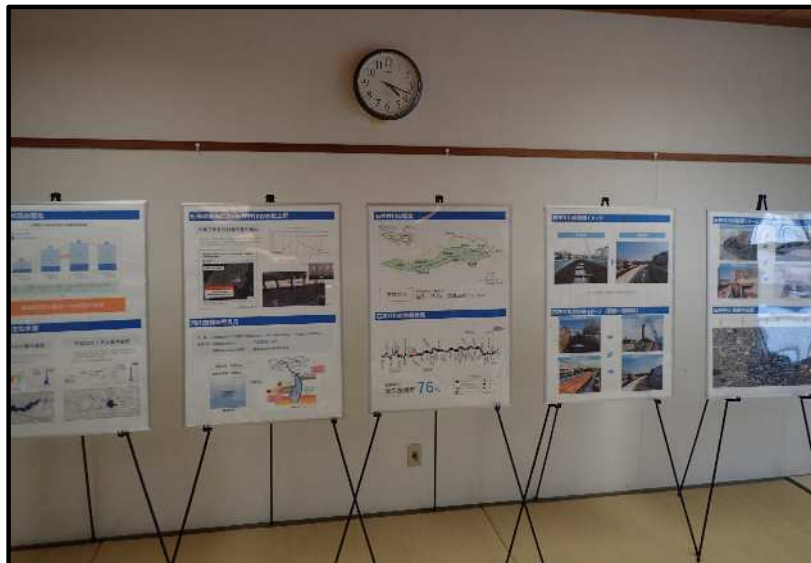
【石神井川の整備概要】