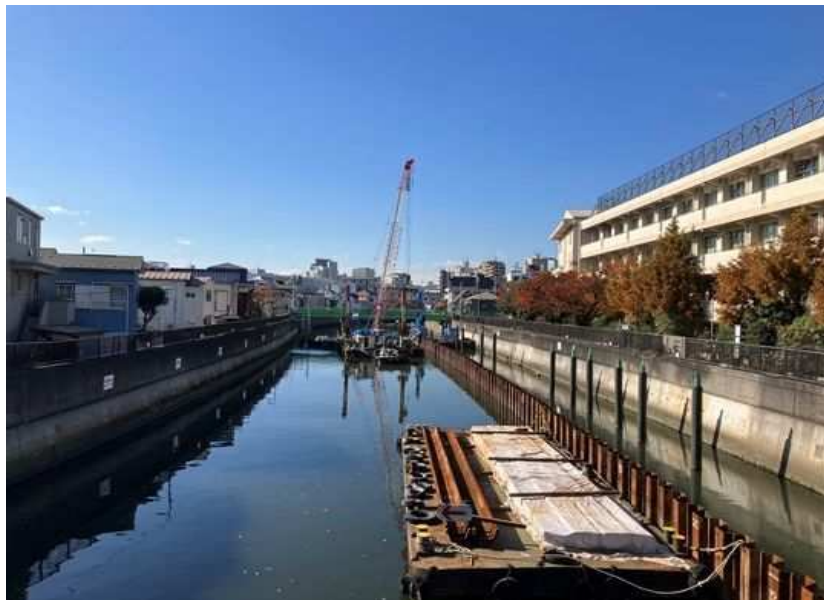
①宝来橋から上流に向かって撮影