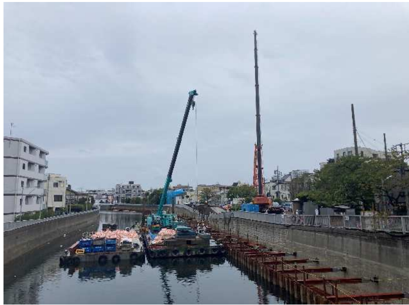
② 右岸 堆積土砂撤去 令和6年11月