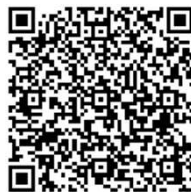
←二次元コード (北区HP『大規模水害を想定した避難行動の基本方針』)