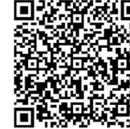
▲二次元コード (北区HP『水害リスク診断書 はやわかり出前講座～荒川が氾濫しそうな時に自宅の上の階に避難できるの?～』)