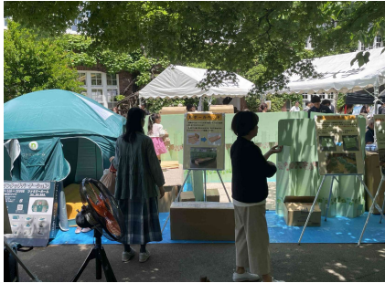
5/11 ALLとしま立教WAKUWAKU防災フェス