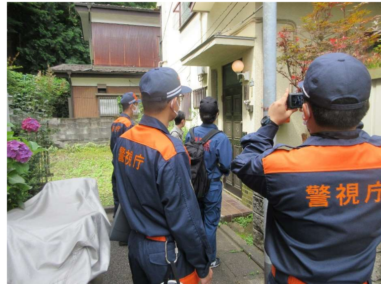
戸別訪問・避難の呼びかけ訓練実施状況