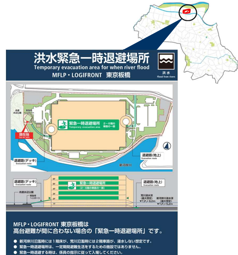
緊急一時退避場所案内板

また、水位低下までの3日間については、本施設に整備をした災害時配送ステーションに備蓄をしている水や食料を提供する。