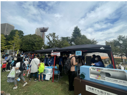
10/13 としまDOKI☆多DOKI防災フェス