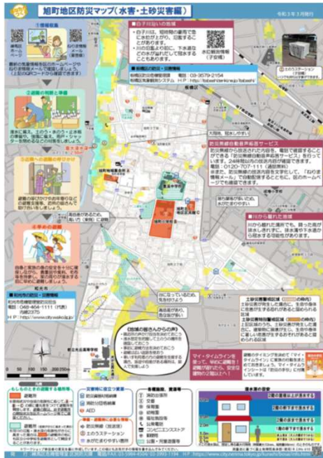
表(水害・土砂災害編)