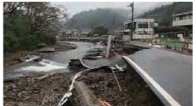
令和元年台風19号被災状況