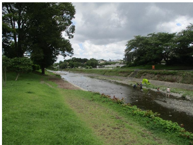
南浅川と接する草地