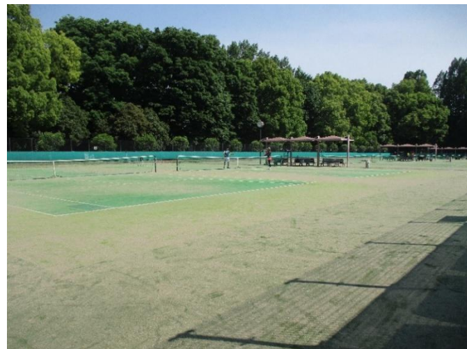
中央地区のテニスコート