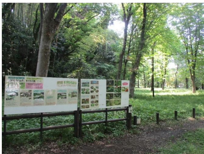
沖山地区のニリンソウ自生地