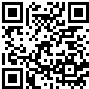
傍聴申込用 QR コード