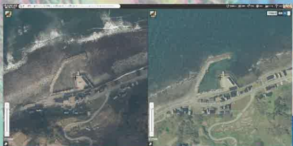
珠洲市長橋町付近