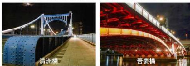
隅田川橋梁群のライトアップパネル

水辺のにぎわいを創出する隅田川ライトアップ橋梁の、ライトアップ中の美しい写真をパネルで展示します。