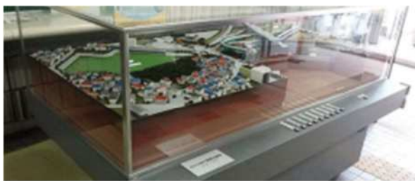
白子川地下調節池模型

都内の練馬区、板橋区内を流れる白子川下流域の水害に対する安全度を向上させる白子川地下調節池群の事業を、模型とパネルで紹介いたします。