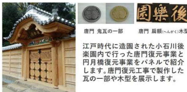
小石川後楽園 唐門