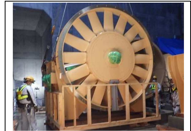
排風機羽根車の搬入据付け状況

日々状況が変化する建設現場では、「安全」が大変重要になります。常に先を見据え、リスクの検討・対策を行うなど、仲間の安全にも意識をおいて行動してください。