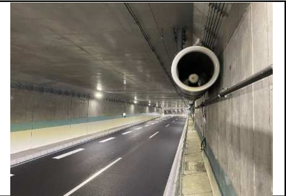
ジェットファン設置状況