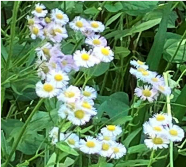
ハルジオン 春紫苑