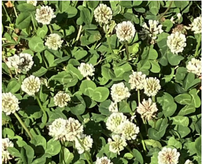
シロツメクサ 白詰草

キク科 ムカシヨモギ属 北アメリカ原産の帰化植物で30～60cmの多年草。大正時代に観賞植物として輸入され、東京で栽培されていた物が、野に逃げ出し戦後各地に広がり野生化しました。名前は春に咲く紫苑(シオン)という意味です。