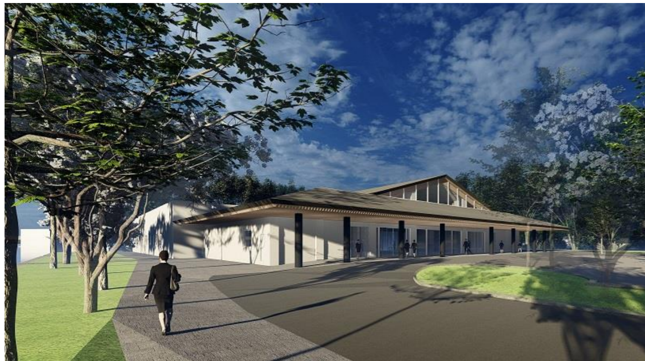
外観イメージ（敷地北側より）