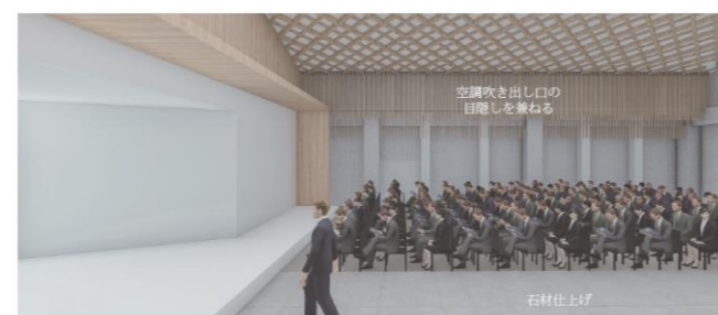
内観イメージ（式場）