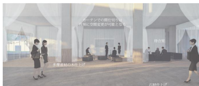
内観イメージ（待合・お清め室）