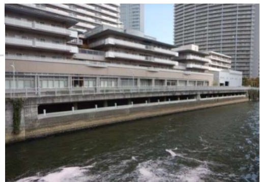
市場橋下流取水施設