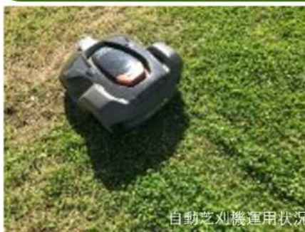
自動芝刈機運用状況