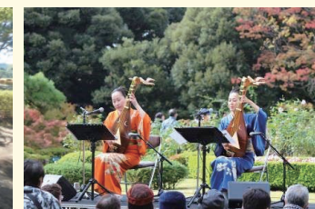
演奏会(旧古河庭園)