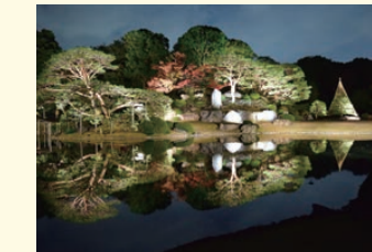
庭園ライトアップ(六義園)