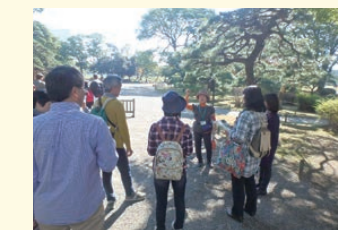
庭園ガイド(浜離宮恩賜庭園)