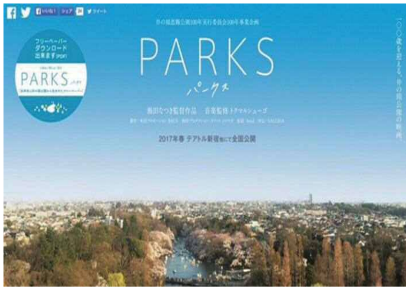
映画「PARKS」宣伝用チラシ