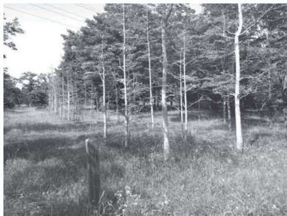
武蔵野苗圃の苗木