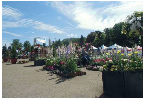
フォトスポットガーデン