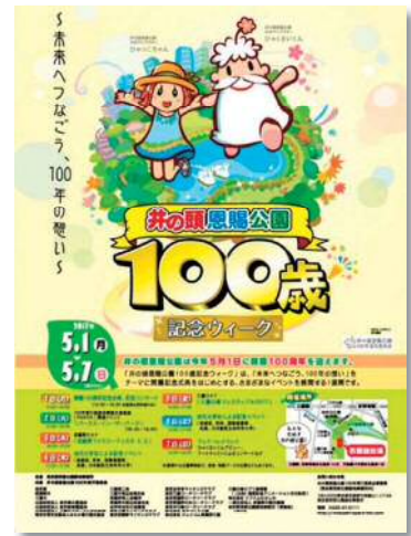
チラシ、アーティストのデザインによるもの

西園競技場のメイン会場では、日替わりを含め7日間で延べ140以上のブースが出展し、ステージでのコンサートなどと共に盛況であった。