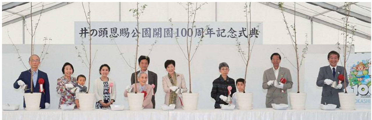
100歳の方などによる記念植樹