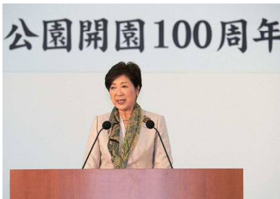
挨拶する小池百合子都知事

式典終了後には、東京消防庁音楽隊とカラーガーズ隊による記念コンサートが開催された。