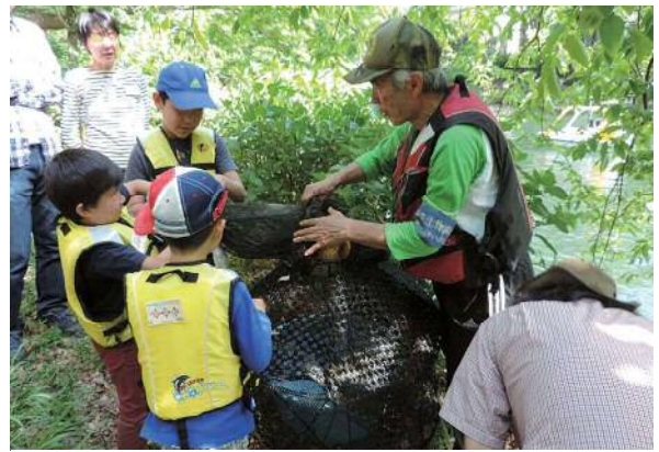
チョコっとかいぼり隊（池の保全活動体験）