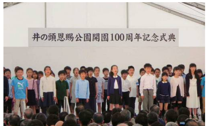
地元小学生による「100年宣言」