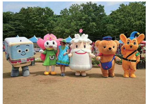
ひゃくさいくんとひゃっこちゃん（中央）