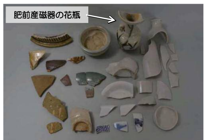
写真三 広場部からの出土遺物