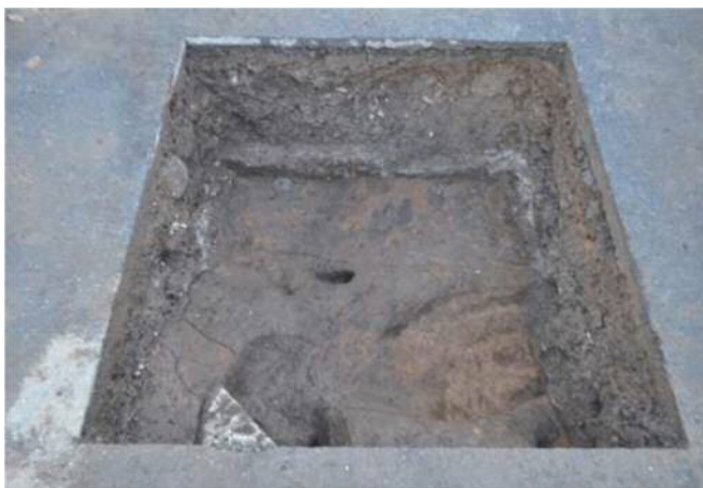
写真二 広場部掘削状況