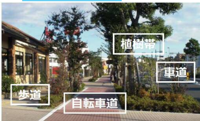
歩道の構造(緑地タイプの例)