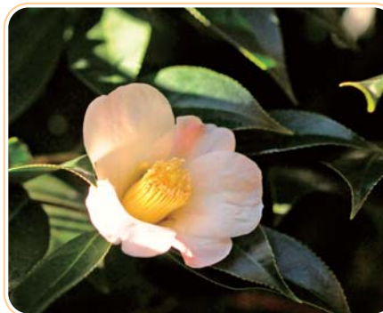
ツバキの園芸品種