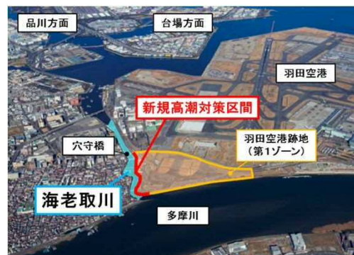
羽田空港跡地第1ゾーンと周辺地区