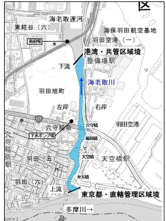
海老取川河川位置図