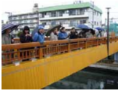
小名木川・横十間川・北十間川等を見学