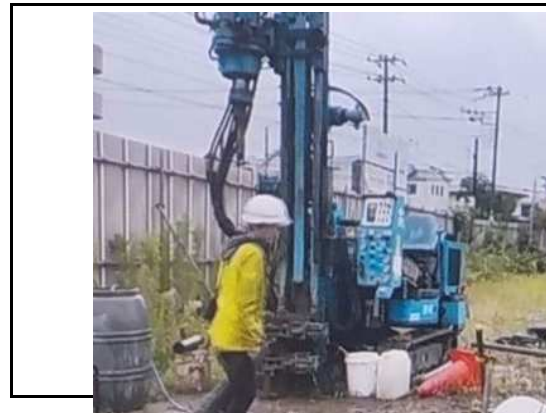
【大型掘削機による施工状況】

調査にあたっては大型掘削機の採用を提案し、現場での作業日数を大幅に短縮した。また、遠隔臨場への取組により業務の効率化を図り、地質断面図の作成では3次元データ化を実施するなど、DX推進にも積極的に取り組んだ。