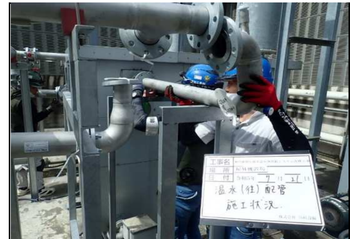
工場製作（プレカット）した配管の現場設置状況 （精緻な3次元モデルを活用することで現場施工時間が短縮できた）

今まで土木の分野で先行して進められてきたBIM/CIMの技術が、私たちのような空調・衛生設備の分野でも本格的に広まっていくことが期待されます。最新の技術を活かし、よりよい日本の社会インフラを盛り上げていきましょう！