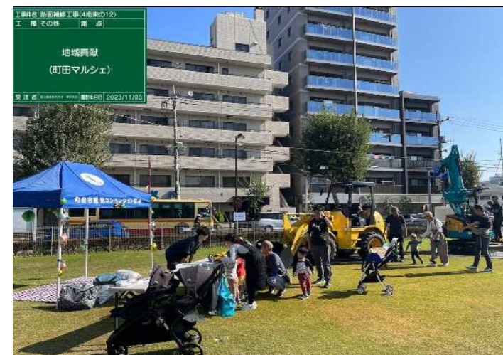
イベント参加状況(乗車体験)

建設業は決して楽な仕事ではありませんが、たくさんの方の協力を得て出来上がった工事程素晴らしいものは無く、その達成感を味わってほしいです。