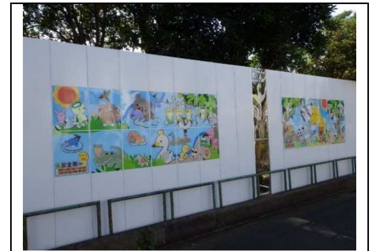
アートサインの設置によるイメージアップ