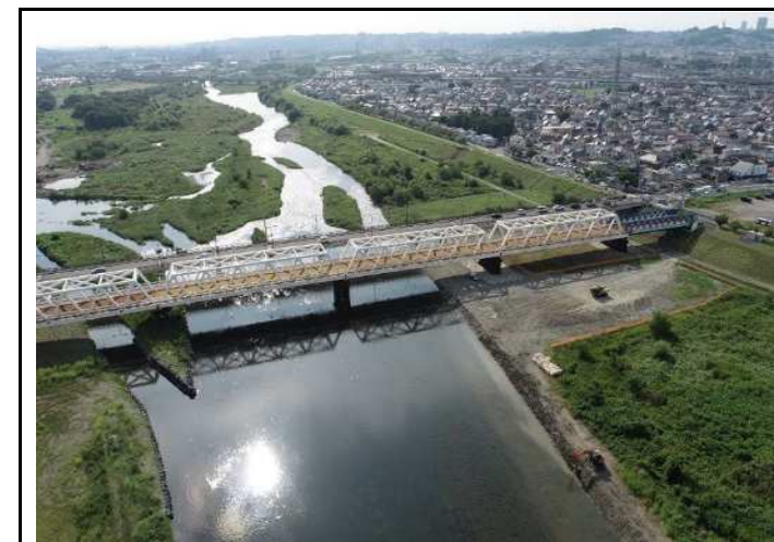
護床工（右岸側）完了状況

災害復旧工事は、地域住民の生活を復旧支援する大事な役割となります。工事完了時の達成感にやりがいを感じると思います。