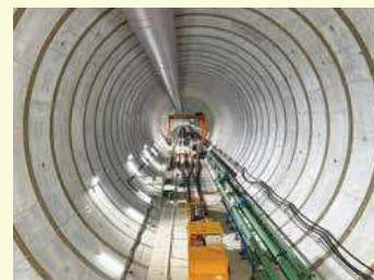
広域調節池シールドトンネル施工状況(内径12.5m)

また歩道部では、視覚障害者誘導用シートの設置や勾配改善などのバリアフリー化を推進しています。