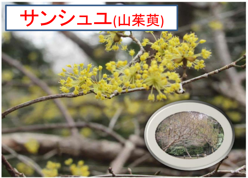
サンシュユ(山茱萸)

葉が開く前に花を咲かせ株全体が黄色に包まれ別名ハルコガネとも言われます。秋に熟す実は疲労回復などの薬効があり中国原産で江戸時代に薬用として渡来しましたが、現在は庭木や公園樹として植えられています。