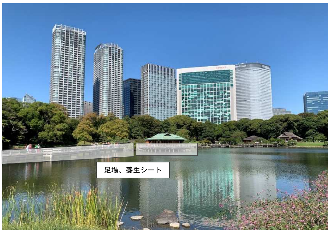
工事中のイメージ