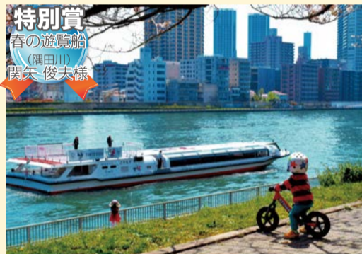
特別賞 春の遊覧船 (隅田川) 関矢 俊夫様