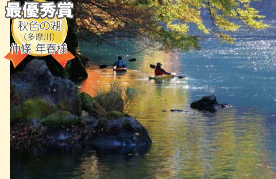
最優秀賞 秋色の湖 (多摩川) 仲條 年春様