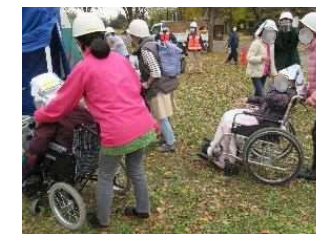
車椅子避難誘導訓練