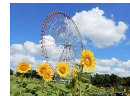
葛西臨海公園 ひまわり花壇