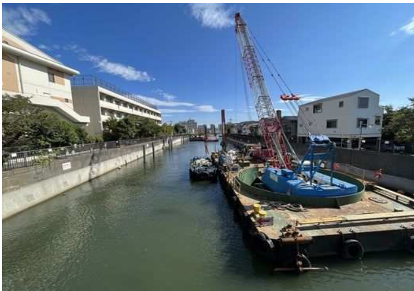
②清水橋から下流に向かって撮影