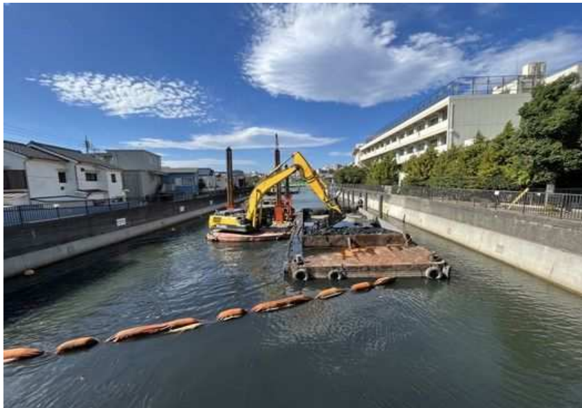
①宝来橋から上流に向かって撮影