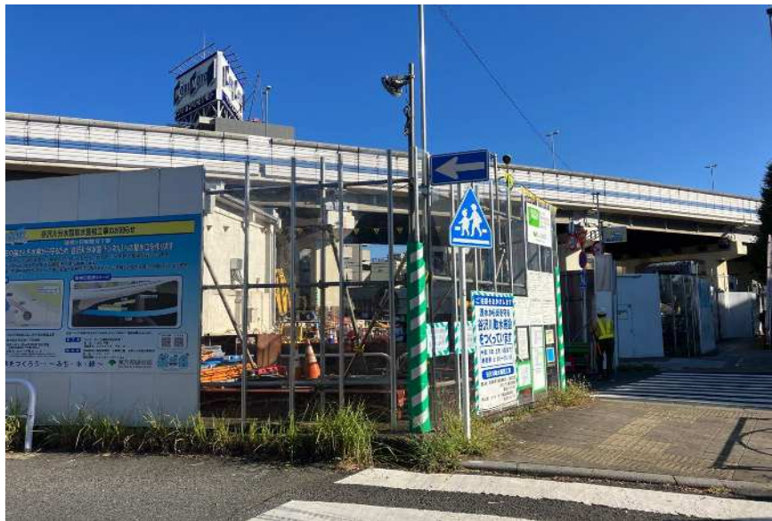
②方向より撮影(国道246号 陸橋から撮影)