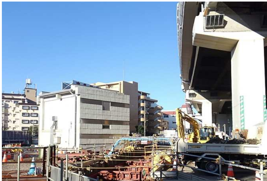
④方向より撮影(西側より撮影)