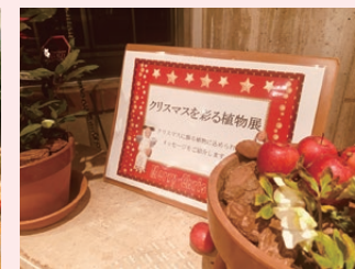
クリスマスを彩る植物展