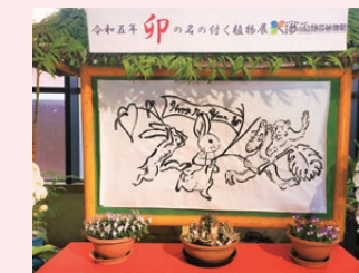
令和5年「卯年」の様子

開催期間：令和5年12月26日(火)～令和6年1月21日(日) (※12月29日(金)日～1月3日(水)は休館) 時間：9:30～17:00(入館は16:00まで) 会場：夢の島熱帯植物館 エントランスホール 観覧料：無料(※入館料は別途かかります) 主催：夢の島熱帯植物館