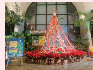
オリジナルクリスマスツリー

開催期間：令和5年11月28日(火)～12月24日(日) 時間：9:30～17:00(入館は16:00まで) 会場：夢の島熱帯植物館 エントランスホール 観覧料：無料(※入館料は別途かかります) ※期間中、クリスマスフラワーアレンジメント教室など各種イベントも開催! 詳細はHPからご確認ください。 主催：夢の島熱帯植物館