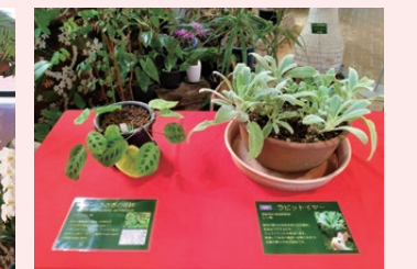
令和5年「卯年」の植物