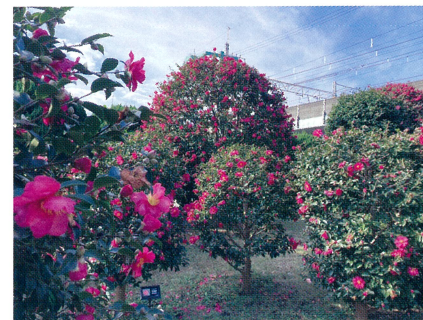
亀戸中央公園のサザンカ

都立公園では、亀戸中央公園、井の頭自然文化園、狭山・境緑道、横網町公園などでご覧いただけます。