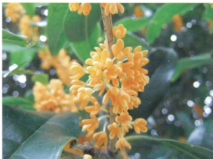
キンモクセイ (金木犀) モクセイ科モクセイ属

今回は、9月下旬～10月中旬に見ごろを迎え、甘く芳醇な強い香りがするキンモクセイとほのかな甘い香りのギンモクセイを紹介します。