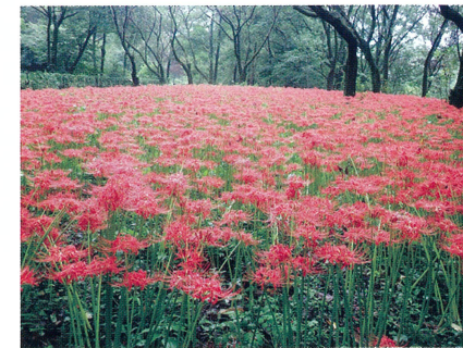
野川公園のヒガンバナ