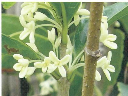
ギンモクセイ (銀木犀) モクセイ科モクセイ属