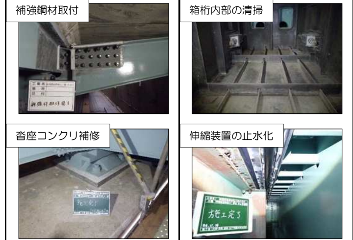
長寿命化工事に伴う提案・実施事項

建設業界では安全性が最優先されます。自己と他者の安全を守るためには、常に安全意識と当事者意識を持ち、適切な安全手順や規定を遵守するのが肝要です。