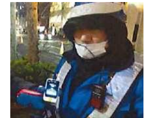
AI自動翻訳機の活用