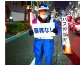
バス利用者等への対応