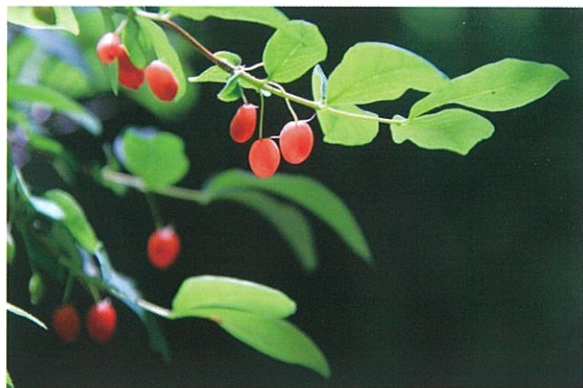
ウグイスカグラ (鶯神楽) スイカズラ科スイカズラ属 学名: Lonicera gracilipes var. glabra

日本原産の落葉低木で、高さは3mほどになります。4月から5月に、赤い小さなラッパ型の花が下向きに咲き、初夏に真っ赤に熟した実は食べられます。