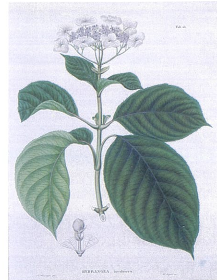
フローラ・ヤポニカに掲載されているタマアジサイの絵 京都大学貴重資料デジタルアーカイブより

ミソハギは、向島百花園、石神井公園、水元公園、神代植物公園、野川公園、小山田緑地、桜ヶ丘公園などでご覧いただけます。