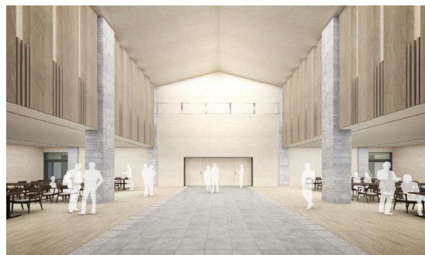
内観イメージ（待合・お清め室）