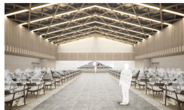
内観イメージ（式場）