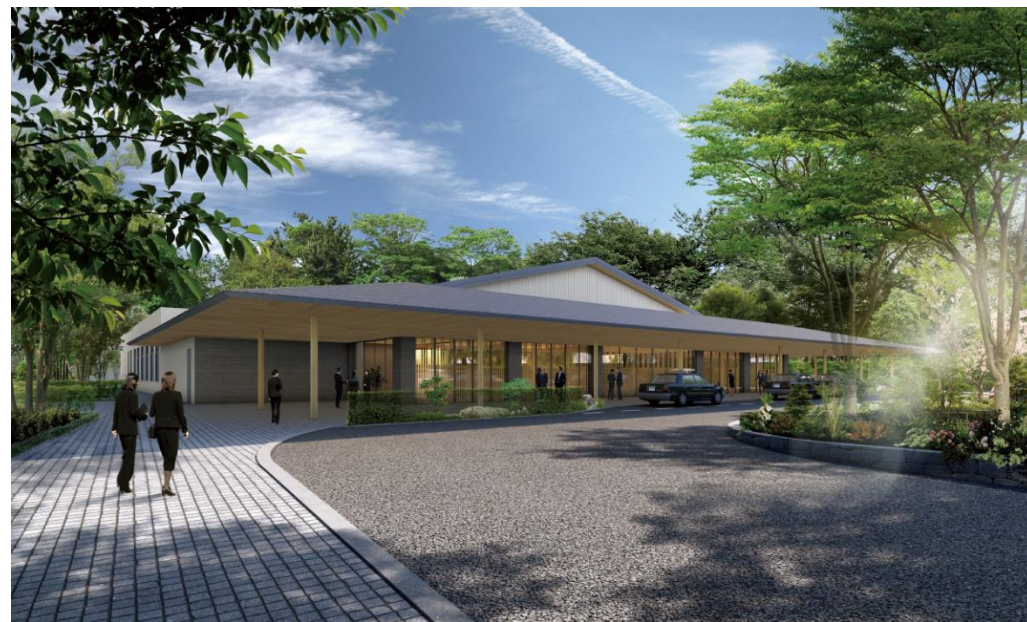
外観イメージ（敷地北側より）