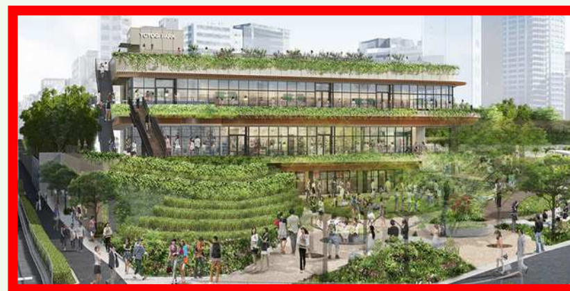
原宿駅側メインエントランス