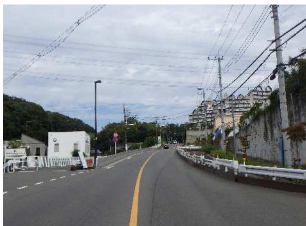
未拡幅区間（起点側→終点側）