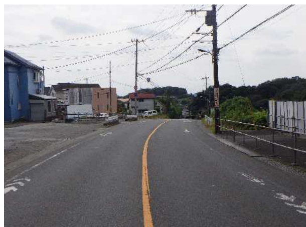
未拡幅区間（終点側→起点側）