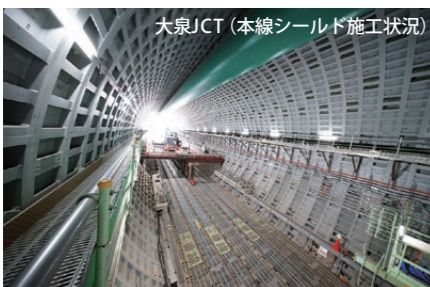
大泉JCT(本線シールド施工状況)

事業者 問い合わせ先 国土交通省関東地方整備局 東京外かく環状国道事務所 TEL:0120-34-1491 (7/24ダイヤル) 東日本高速道路株式会社 関東支社 東京外環工事事務所 TEL:0120-861-305 (7/24ダイヤル) 中日本高速道路株式会社 東京支社 東京工事事務所 TEL:0120-016-285 (7/24ダイヤル)