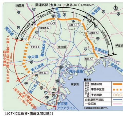
[JCT-ICは仮称・開通区間は除く]

引き続き、事業者一同細心の注意を払い安全に工事を進めて参りたいと思っておりますので、ご理解・ご協力のほどよろしくお願い申し上げます。