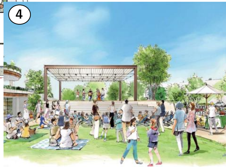
にぎわい広場と発信テラス