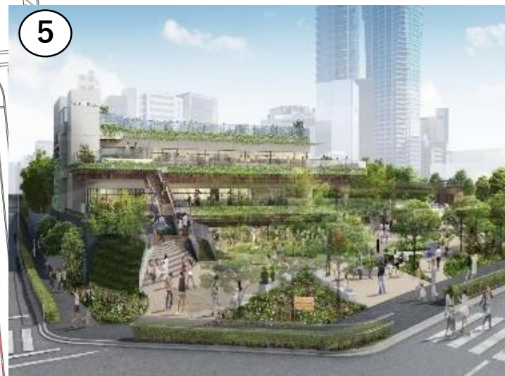
原宿側からのメインエントランス