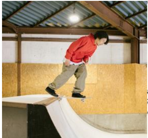
屋内外でスケートボードを楽しめる アーバンスポーツパーク