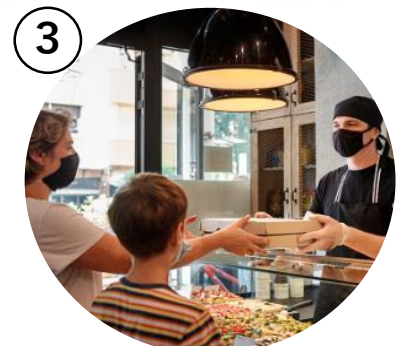
屋内外で飲食可能なフードホール