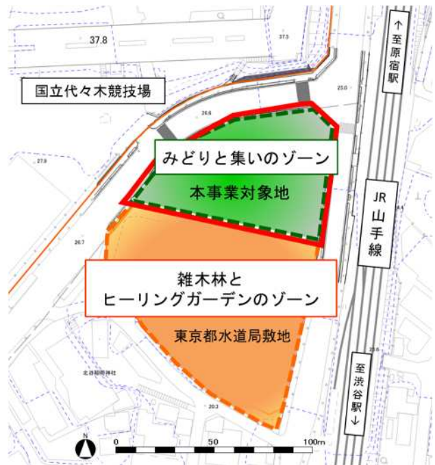
【代々木公園ゾーニング図】

本事業対象地は、北側の「みどりと集いのゾーン」に該当する。なお、南側の「雑木林とヒーリングガーデンのゾーン」については、現在、東京都水道局のポンプ所として利用中であり、今後、給水所として整備を予定している。南側の「雑木林とヒーリングガーデンのゾーン」の整備は、水道施設の整備とあわせて公園整備を行う予定となっており、先行整備を行う本事業対象地との一体的活用を図っていく。